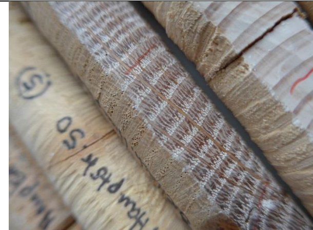
Januar 2017 /Bohrkerne Dendrochronologie

Alle Angaben erfolgen ohne Gewähr und eine Prüfung durch das Energie- und Bauberatungszentrum Pforzheim/Enzkreis (ebz) hinsichtlich der Qualität der aufgenommenen Unternehmen und Richtigkeit der Angaben ist nicht erfolgt.